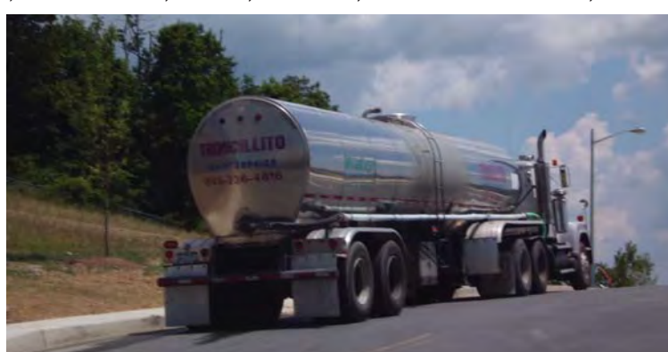
די טאנקיר טראקס ברענגען וואסער קיין קרית יואל

דער ריינער אמת אז די אלגעמינע תושבי קרית יואל דארפן זיך טאקע ב"ה נישט זארגן טאג טעגליך איבער זייער וואסער סופלי, א דאנק די געטרייע און איבערגעגעבענע ארבעט פונעם וויליידזש וואסער דעפארטמענט. ערב ובוקר וצהרים קען מען צוגיין צום קראן און זיך דערקוויקן מיט א געשמאק גלעזל וואסער, ווי אויך איז ב"ה דא גענוג וואסער פאר אלע אנדערע געברויכן ווי קאכן און וואשן אד"ג.