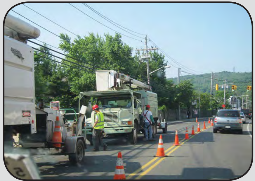
די אראנדזש ענד ראקלענד עלעקטעריק פירמע בוי די ארבעט אראפצושניידן די ביימער און צווייגן וואס שטעלן אין געפאר די עלעקטעריק ווייערס