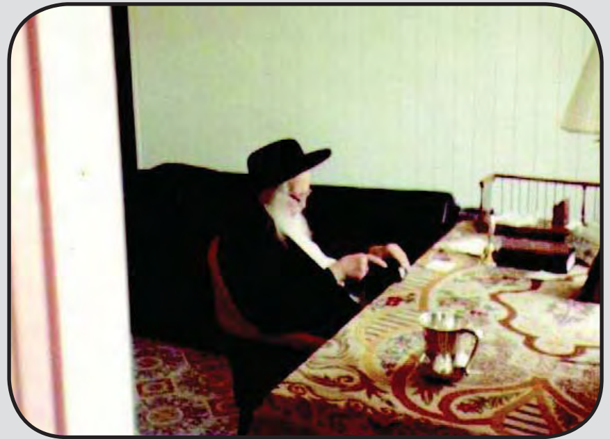
פארך חבוש עליך, דער רבי איז עוסק בעבוח"ק מלובש מיט די מלית און תפילין