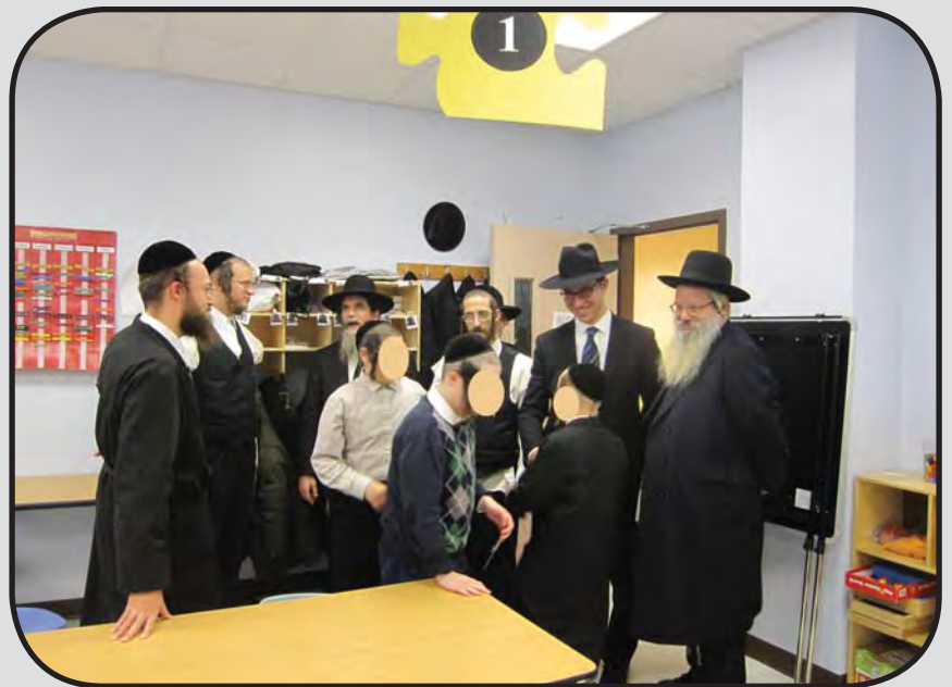
די געסט באזוכן אין די קלאס צימערן פון שערי חמלה