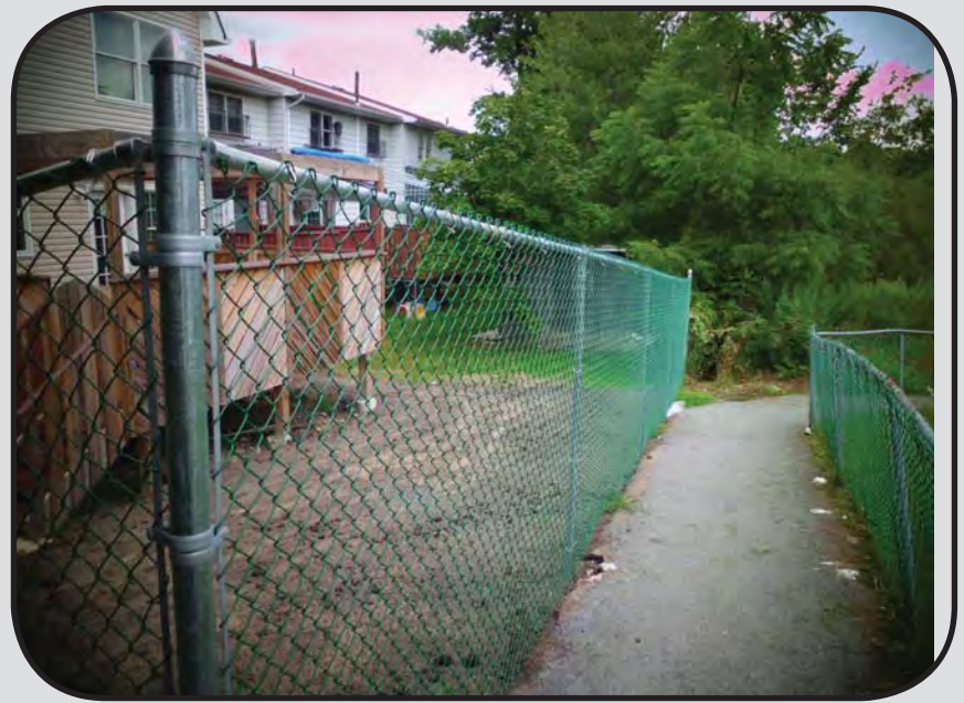
דער ווילידזש האט געלייגט א נייעם צוים ביים שארט קאט צווישן העים און ארשיווע קט. נאכדעם וואס די אלטע איז שוין געווען אין זייער א נאכגעלאזטן צושטאנד