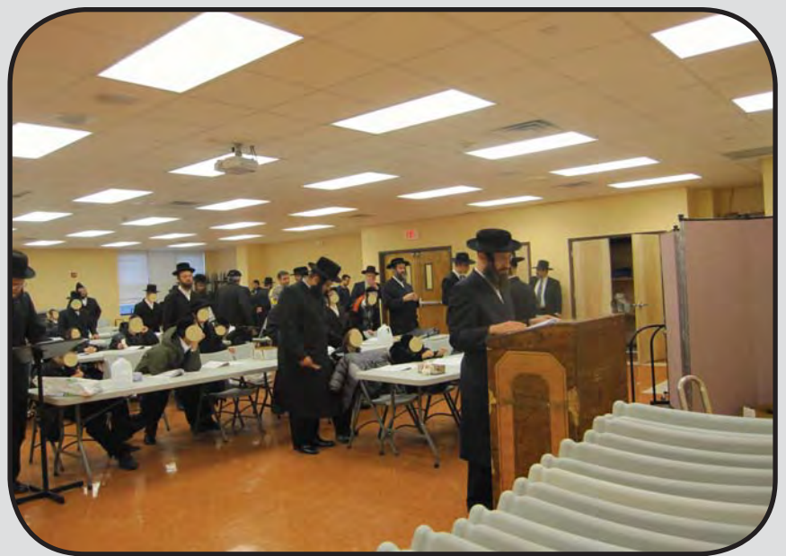
די געסט האבן מיטגעדאווענט מנחה מיט די תלמידים פון שערי חמלה