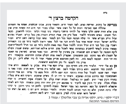
ההקדמה בספר דברי יוסף, שבעמקת ג"כ הכתב הורמנא שלו ממרן הקדושת יו"ט זי"ע